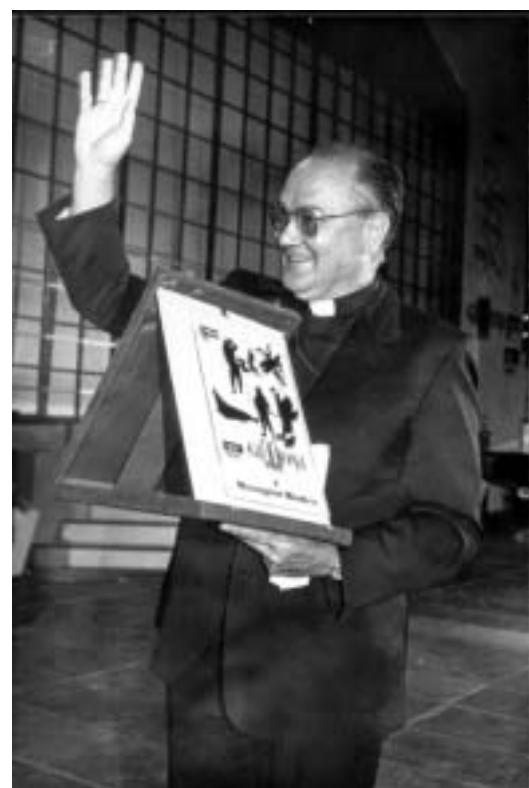
Gli auguri del festival al Cardinale Martino

Ha voluto vedere anche la sua Giffoni, il cardinale Martino, in occasione del suo primo ritorno a Salerno, la sua città di nascita, nelle vesti di cardinale. Domenica, 30 novembre, Sua Eccellenza, ha fatto visita al paese della sua infanzia, Giffoni, terra d'origine di sua nonna, la nobildonna Sorgente degli Uberti. Lo ha fatto in un alternarsi di emozioni, di ricordi, di mille volti legati al suo passato. Al cardinale, che fu tra i protagonisti della 22ª edizione del Giffoni Film Festival, nel 1992, l'intero staff del festival internazionale del cinema per ragazzi rivolge i suoi migliori auguri. Nella speranza di poterlo rivedere proprio a Giffoni, tra i bambini dell'Europa, dell'America, dell'Asia come dell'India. Paesi dove l'instancabile lotta dei diritti umani portata avanti dal cardinale Martino ha davvero cambiato in meglio molte cose. Facendo conoscere il significato di parole come libertà, pace, rispetto degli altri.