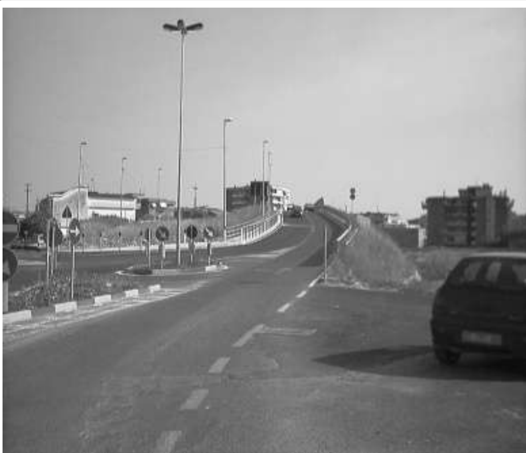
Il cavalcavia di Via Serroni, riaperto nei giorni scorsi.

Dopo due anni lunghi come 2 decenni soprattutto per i residenti della zona, è stato riaperto il cavalcavia di Via Serroni che era stato chiuso con ordinanza della Provincia per lavori di adeguamento della A3 SA- RC. La lentezza nella riapertura è stata probabilmente anche causata dalla mancata realizzazione del passaggio pedonale che rendeva l'opera non sicura per chi doveva percorrerla a piedi. Oltre al passaggio pedonale si è provveduto alla realizzazione di piccoli interventi quali bande sonore, lampeggianti sull'aiuola del minisvincolo ed altri accorgimenti per garantire la massima visibilità. La riapertura è stata accolta con soddisfazione da tutto il quartiere che in questi due anni si era sentito diviso in due.