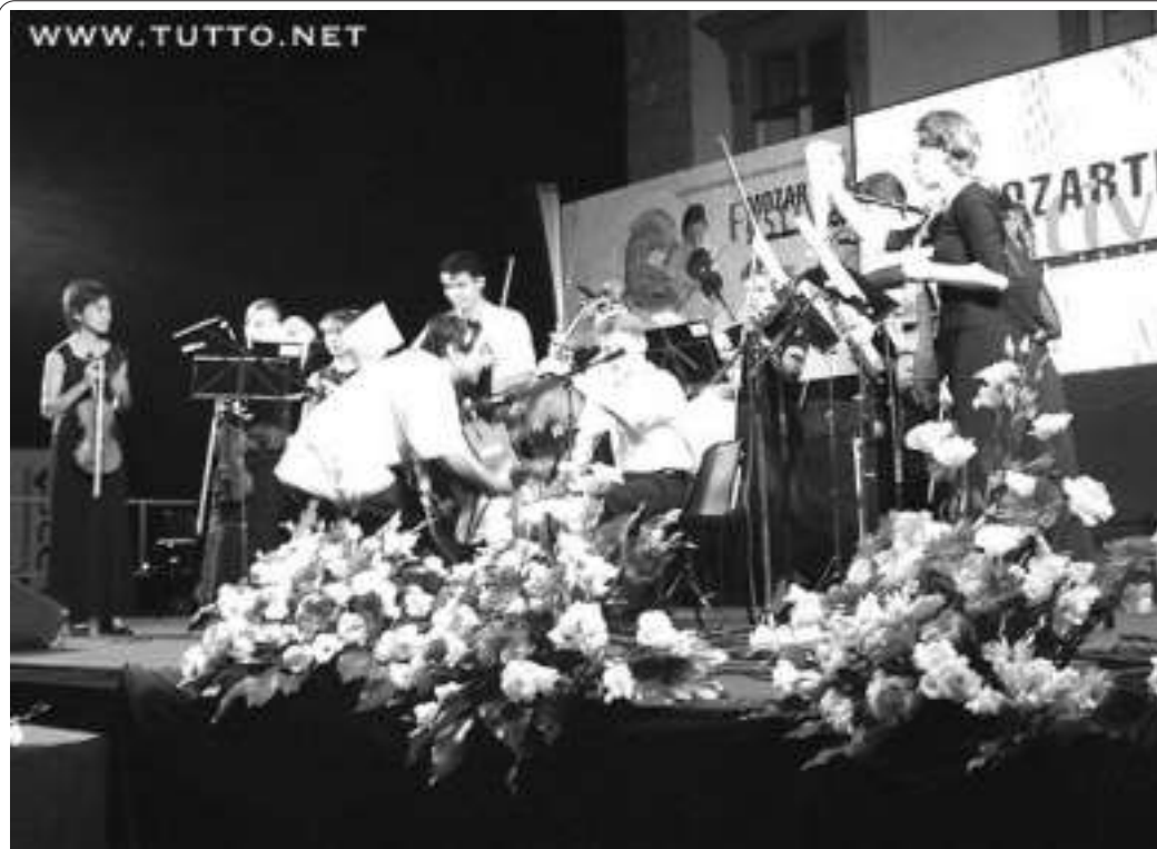
Concerto orchestra giovanile "Ėajkovskij" di Mosca; dirige Alvia Vandyshva

di Maddalena D'Onofrio e Nilde Giaquinta