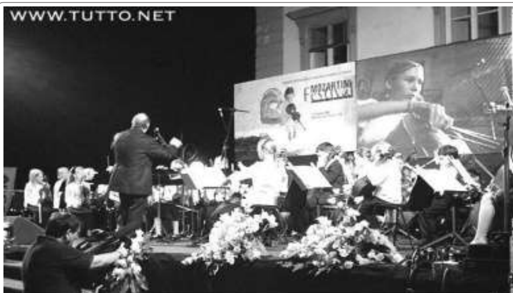
Concerto dell'Orchestra finlandese "Helsinki Children's Strings" di Helsinki

Oltre a questa importantissima partecipazione in cantiere vi è l'invito alla Manifestazione "Uto Ughi per Roma 2003" che vedrà la "Mozartini National Orchestra" ed il "Mozartini Chorus" tenere un concerto nella Chiesa di S. Maria sopra Minerva a Roma. Non ci sono confini per questi bambini di varie nazionalità... la musica è un linguaggio universale che li unisce sopra ogni cosa: oltre ad alimentare la loro passione, il "Mozartini Festival" alimenta l'unione dei popoli e la nascita di amicizie, difatti parecchi bimbi ritorneranno anche in agosto nella nostra città ospiti delle stesse famiglie che li ha accolti in queste 9 giornate... uniti come una grande famiglia!