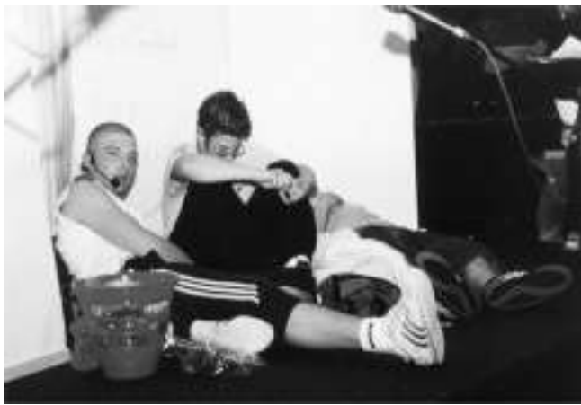
In alto, rappresentazione degli alunni del progetto "Teatro" nel teatro dell'Istituto Comprensivo Romualdo Trifone" (Montecorvino Rovella, 6 Giugno 2003).