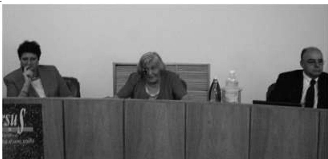
Al centro l'illustrissima astrofisica Margherita Hack