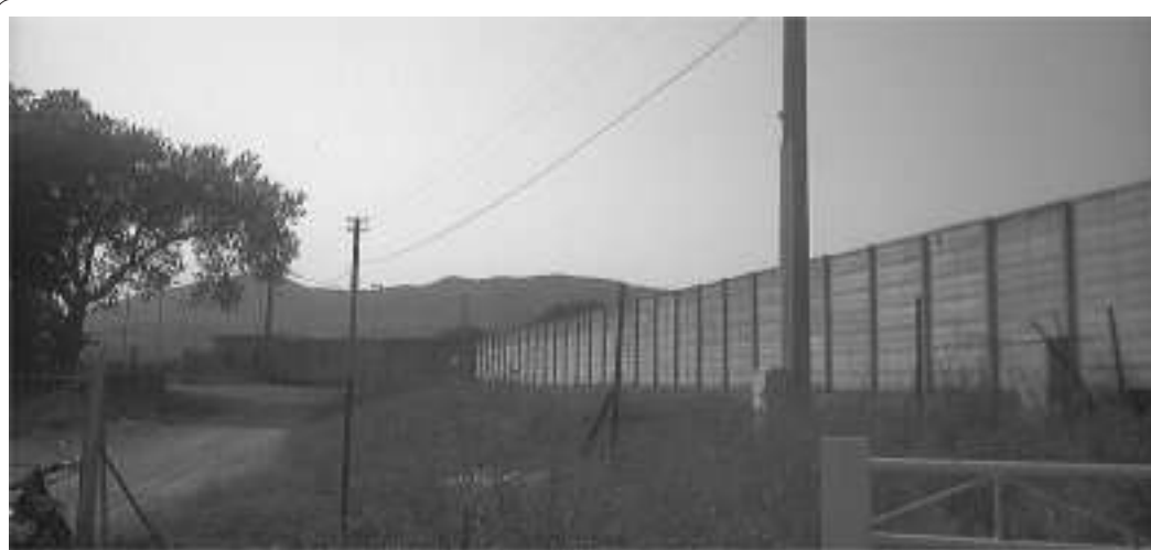
Il Campo Sportivo "Provenza" di Macchia

contributi vengono rilasciati anche dal nostro Comune, vedi Mozartini, banda musicale, importantissimi per il nostro paese, ma per lo sport niente, come mai? Vi lascio con questo interrogativo al quale ognuno potrà dare una risposta; io, invece, aspetto quella del diretto interessato, cioè del nostro Sindaco.