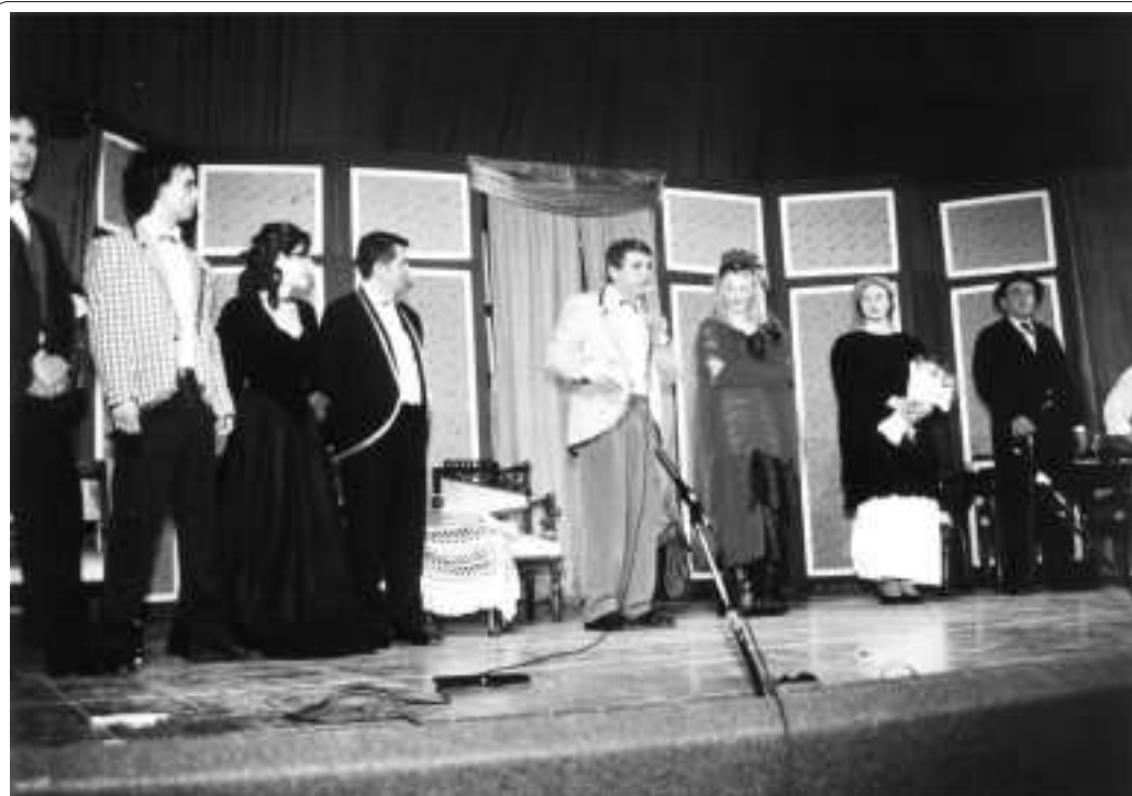
"A' Nanassa" rappresentata lo scorso 7 giugno al teatro "Valle" di Giffoni Valle Piana

Altra interessante commedia interpretata è stata "Cane e gatto" sempre di Eduardo Scarpetta. Essa è stata rappresentata in diverse occasioni: il 29 luglio del 2000 in Piazza Umberto I di Montecorvino Rovella, il 7 gennaio del 2001 al comune di Bellizzi ed il 3 maggio del 2001 al Teatro Garofalo di Battipaglia. Il tema dominante di questa commedia è la gelosia, nella quale si trova invischiato, come al solito, Felice Sciosciammocca. Anche questa rappresentazione ha riscosso grandissimo successo e plausi da parte del pubblico. Tutte queste rappresentazioni sono state finanziate oltre che dagli stessi attori, anche da diversi e affezionati sponsor, che seguono con entusiasmo i progressi della compagnia, apprezzandone molto gli sforzi e l'impegno.