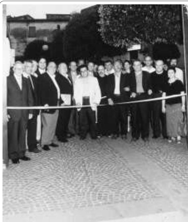
L'inaugurazione della Mostra dello scorso anno

dell'Associazione Culturale di Montecorvino Rovella). Nella mostra verranno allestiti tantissimi stand e i settori interessati saranno molti, dall'artigianato al commercio, dai prodotti tipici all'industria, fino al settore terziario. Una novità sarà rappresentata proprio da due stand dell'associazione organizzatrice dove verranno esposti dei saponi prodotti artigianalmente con un composto di olio extra vergine di oliva, prodotto delle colline montecorvinesi, con l'aggiunta delle migliori e selezionate materie prime di Montecorvino Rovella: oli essenziali, terra naturale, erba e fiori. Nelle varie serate si esibiranno prima il gruppo folkloristico internazionale "O revota popolo", poi ballo in piazza della scuola di ballo Ubaldo Verace e infine nella serata conclusiva vi sarà il Miss-Grad Prix Monti Picentini il più bello d'Italia, belli e bravi 2003.