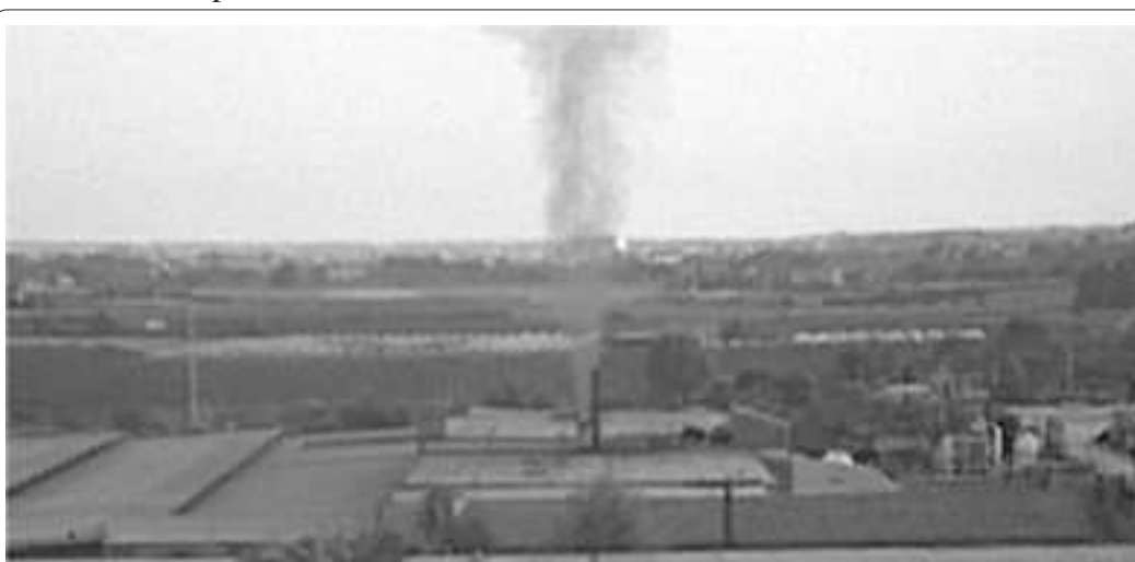
Il fumo delle fornaci nella zona est di Bellizzi

dell'autorità comunale o, quanto meno, un chiarimento approfondito delle effettive condizioni di pericolo che gli scarichi della fabbrica possono provocare. Con questo, non si intende condannare l'operato della ditta, né criticare il lavoro dei dipendenti che essa possiede. Semplicemente si vogliono spronare le autorità competenti ad impegnarsi a garantire una migliore vivibilità ai cittadini e una conseguente maggiore serenità ai lavoratori.